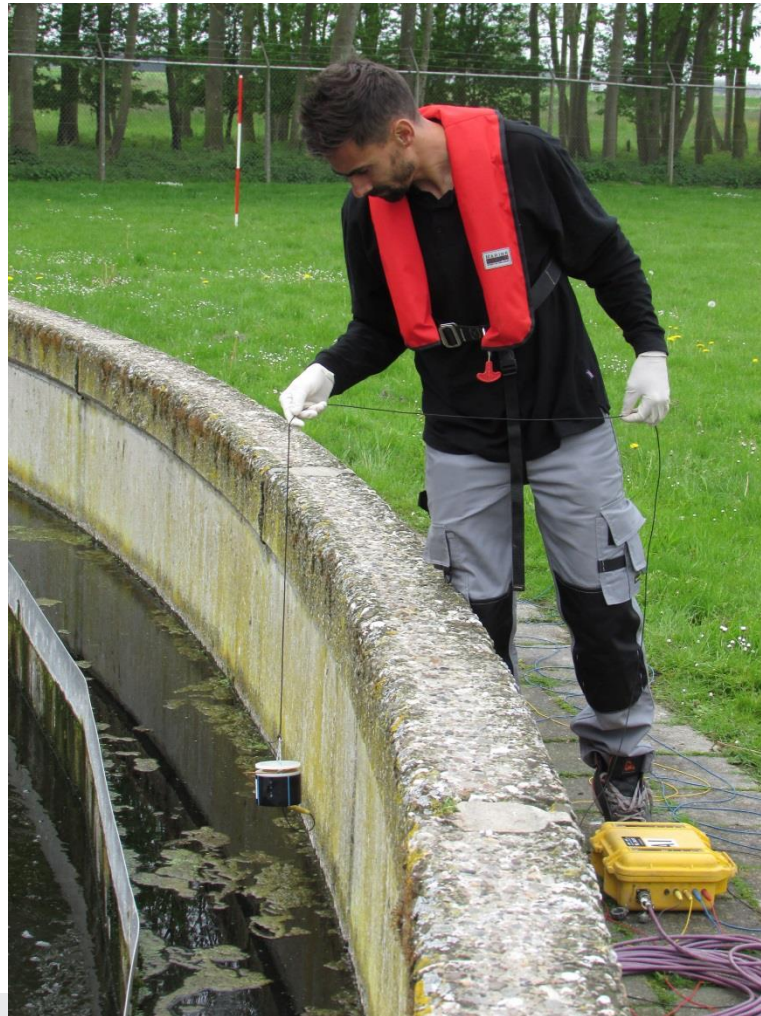
Aanbrengen meetelektrode.