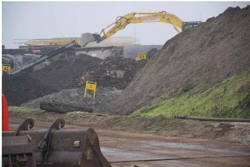
Foto: Risico op energieoverslag.

Voorafgaand aan de geo-elektrische meting moet worden beoordeeld of een energie overslag van de te inspecteren voorziening kan plaatsvinden, die de meting beïnvloedt. Als er getwijfeld wordt of energieoverslag plaats kan vinden, dan kan vooraf op locatie een testmeting of nader onderzoek ter plaatse van de rand worden uitgevoerd.